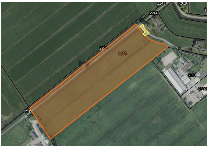
Figuur 3, Nieuw te vestigen erfdienstbaarheid

Middels een dam, naar het bestaande toegangspad. Hiervoor zal een nieuwe erfdienstbaarheid worden gevestigd om te komen en te gaan naar de openbare weg 1 e Velddwarsweg te Waverveen. Met als heersend erf het "verkochte" en als lijdend erf het bij eigenaar in eigendom verblijvende gedeelte van het perceel. Zie onderstaand figuur (3 & 4), waarin geel gearceerd de nieuw te vestigen erfdienstbaarheid en in het oranje gearceerd het "verkochte".