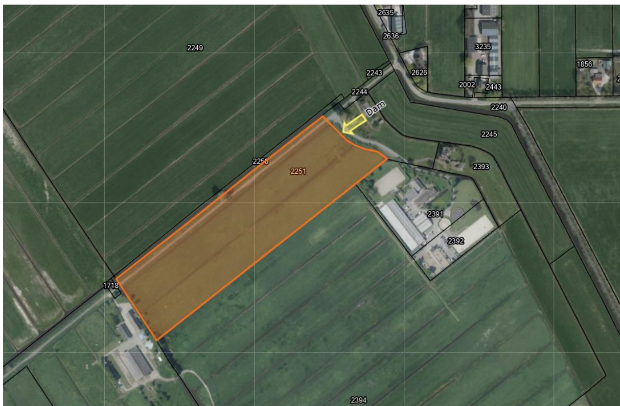
Figuur 1, Landbouwgrond 1e Velddwarsweg 1 te Waverveen

Gelegen om en nabij 1e Velddwarsweg 1, te 3646 AT Waverveen