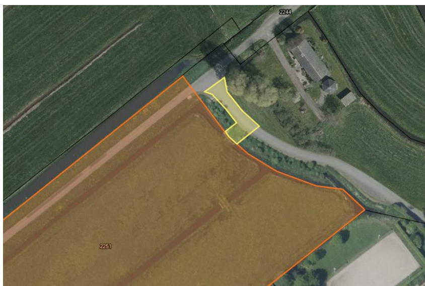
Figuur 4, Nieuw te vestigen erfdienstbaarheid